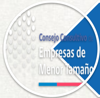
Tabla SESIÓN DE HOY