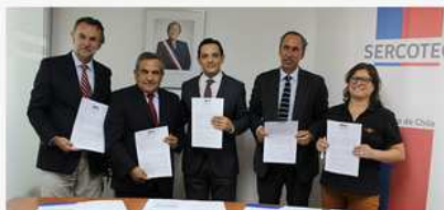
REGIÓN METROPOLITANA 04.03.2015

Sercotec firma acuerdo de desempeño a...